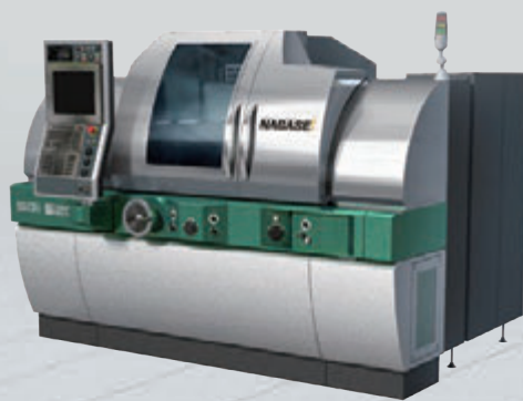
超精密成形平面研削盤