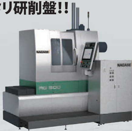
超精密ロータリマルチ研削盤